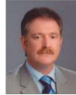
Timurçin SAYLAR Meclis Başkanı