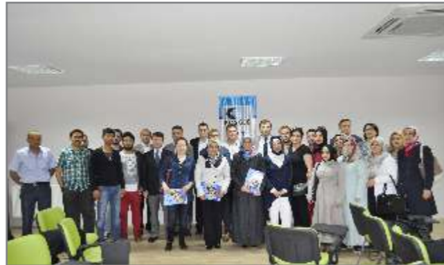
12.06.2014 Girişimcilik Eğitimi sertifika töreni yapıldı.