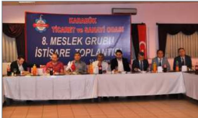
10.06.2014 8.Meslek Komitesi İstişare Toplantısı yapıldı.