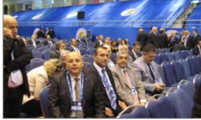
22.05.2014 Odamız Yönetim Kurulu Başkanı ve odamız TOBB delegeleri TOBB 70.Genel Kurul Toplantısına katıldı.