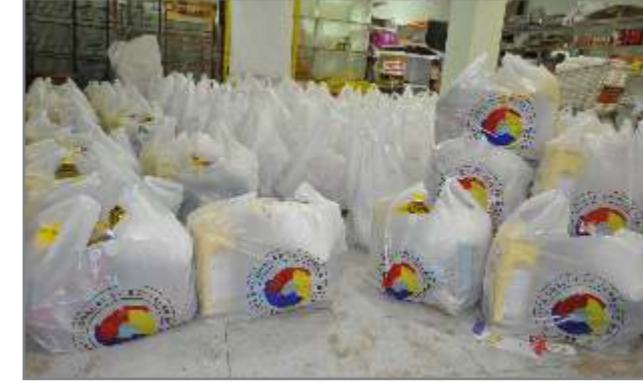
11.07.2014 TOBB tarafında her yıl düzenlenen Ramazan Kumanyası yardımı yapıldı.