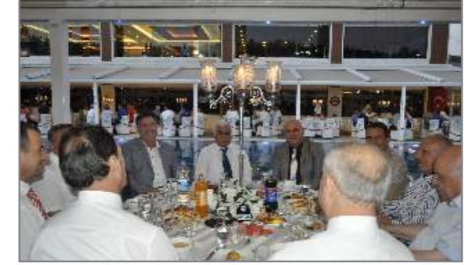
10.07.2014 Odamız üyeleri için iftar yemeği verildi.