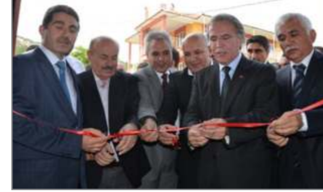
29.06.2014 Cumayanı Şaban Namal camii açılışı yapıldı.