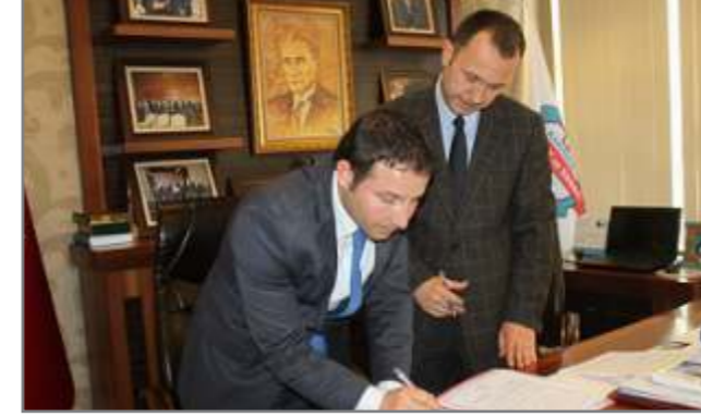
18.04.2014 Mesleki eğitim merkezi ve odamız arasında hijyen eğitimi protokolü imzalandı.