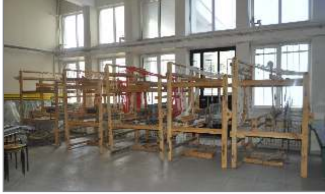
19.03.2014 Ceza İnfaz Kurumuna dokuma tezgahı yardımı yapıldı.