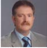
Timurçin SAYLAR Meclis Başkanı