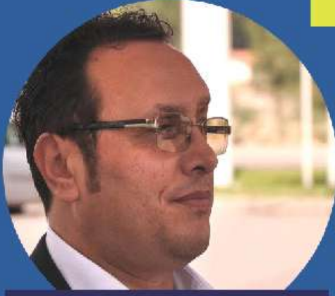
A sınıfı İş Güvenliği Uzmanı