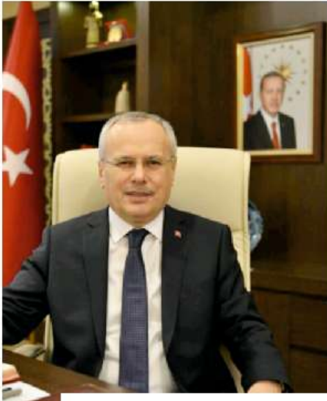
Mehmet CEYLAN Çevre ve Şehircilik Bakan Yardımcısı