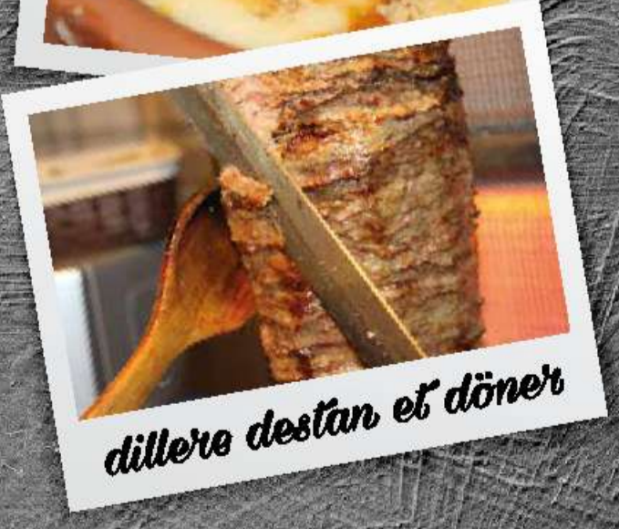
dillere destan et döner

Gerdan ile kaliteli lezzetleri uygun fiyatlara tadın