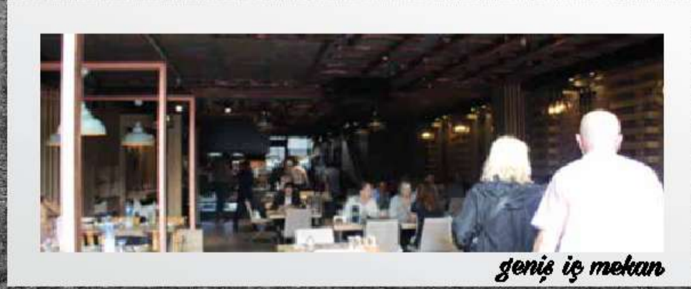
geniş iş mekanı