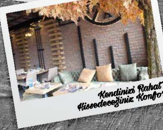
Kendinizi Rahat Hissedeceğiniz Konfor