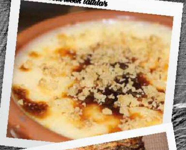
Tazele hissedirvecek tatlılar